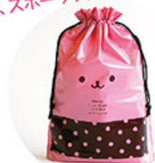
小物を入れたイメージ